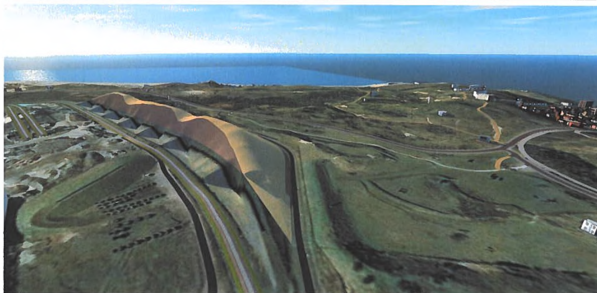
"Artist impression" met zicht op het westen van het beoogde kunstduin (Fig. 3.1 Passende Beoordeling)